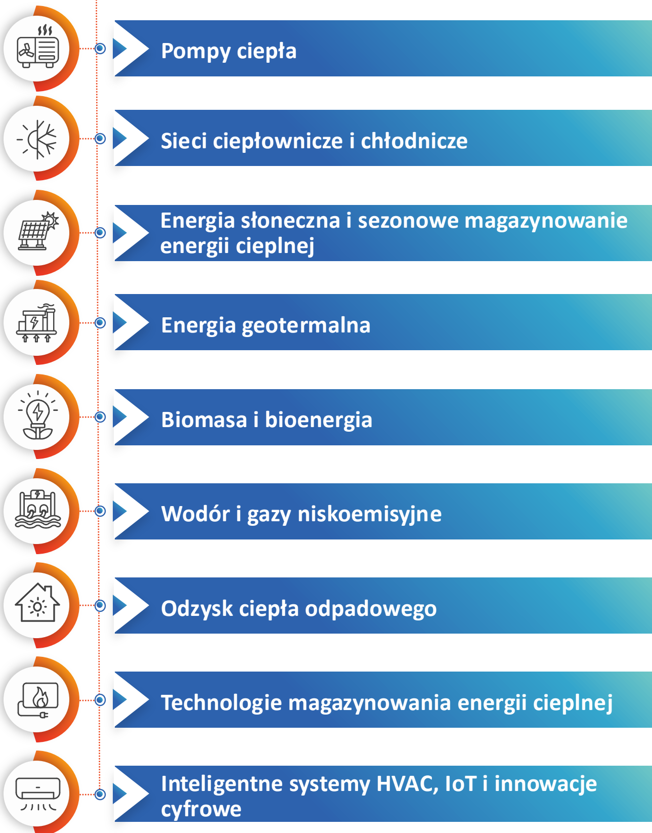
Rysunek 1. Technologie dostosowane do zrównoważonego ogrzewania i chłodzenia

Rodzaje technologii dostosowanych do zrównoważonego ogrzewania i chłodzenia przedstawiono na rysunku 1.